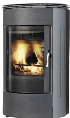
Ecofire Stefania med stålsidor