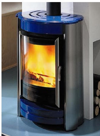
Ecofire Olivia med rostfria sidor