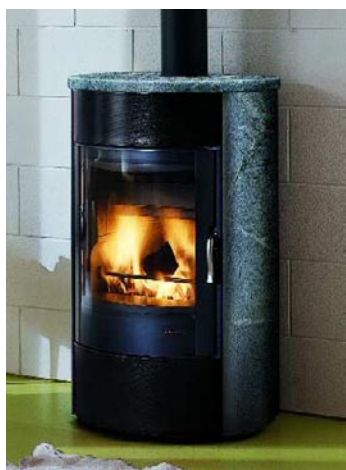
Ecofire Betty med täljsten