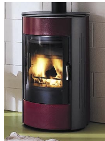
Ecofire Betty med stålsidor