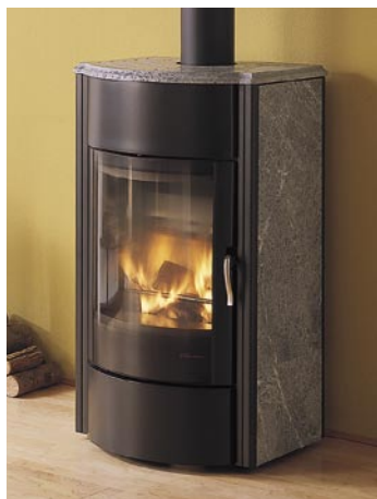
Ecofire Antonia med täljsten